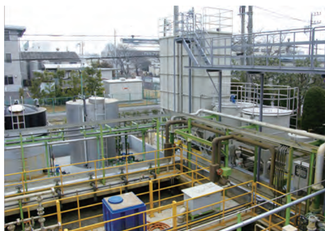
リネス東松山工場の廃水処理施設